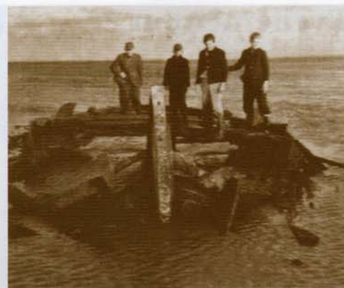
En de zee was er nog, zo ook de kwajongens (1958, Wouter Heijnen).

Een paar oude Spakenburgers weten nu nog wel verschillende schepen te liggen met hun nummer erbij. Zelfs in 1973 is er nog een botter terecht gekomen op het kerkhof. De BU15 was één van de laatste schepen die hier haar laatste rustplaats kreeg. Er zijn nog veel schepen zichtbaar, maar er liggen er nog veel meer onder het zand. Ook verderop richting Nijkerk lagen er nog wat, maar die zijn veelal verdwenen bij zandwinning in dit gebied. Het grootste deel van de foto's is in 2000 gemaakt bij een harde storm. Voordat de dijk van Flevoland voor de deur lag, viel het vaker droog,